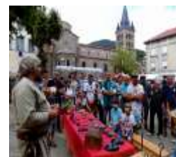
atelier de serrurerie