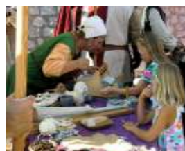
atelier du mouton